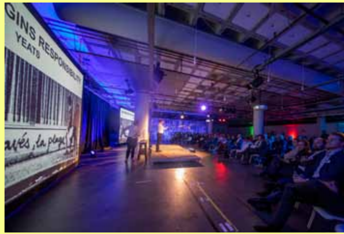
Rijksbouwmeester Floris Alkemade