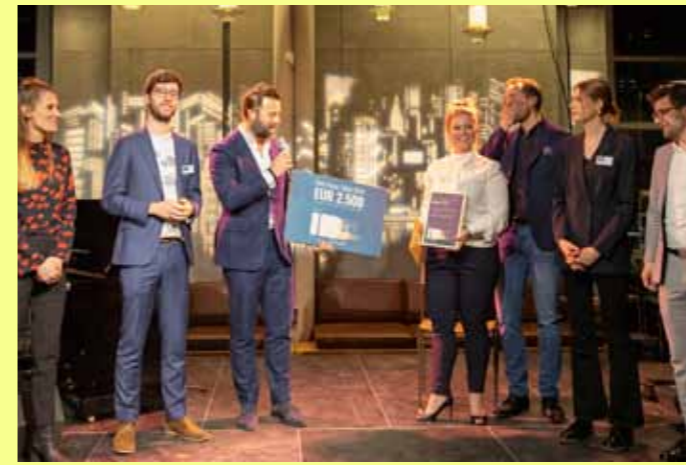
Prijstitreiking Stichting Wiechert Young Talent Award 2019